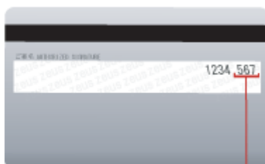
セキュリティコード